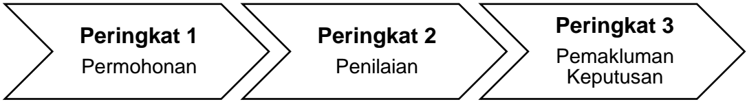
Rajah 1: Peringkat permohonan tajaan

5.1 Terdapat tiga (3) peringkat untuk permohonan seperti ditunjukkan dalam Rajah 1: